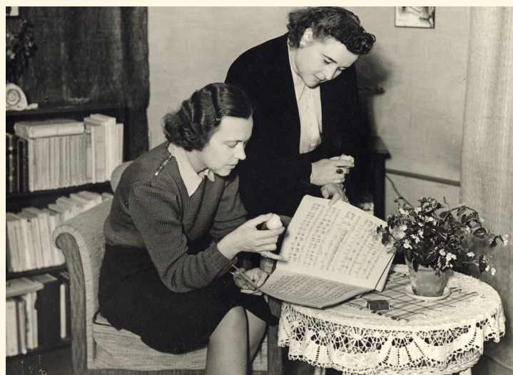
Yhteiskuva rannalla 1933