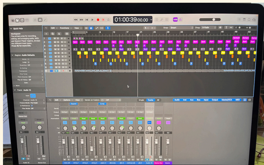
Säveltäminen Wanteen ja Joutsenon ääniraidoista, Logic-kuvake. Kuva: A. Swan Kuva: A. Swan