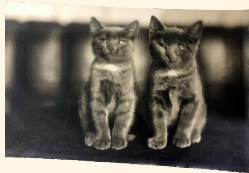
K+A+A Kaksi kissanpentua