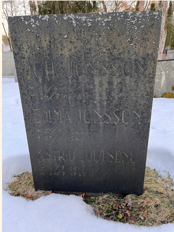
Poissaolo Astrid Joutsenon hautakivi Turun vanhalla hautausmaalla keväällä 2024