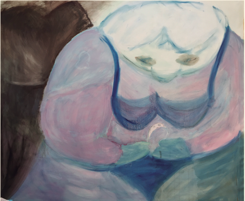
"Se oli hyvä uni", 2024