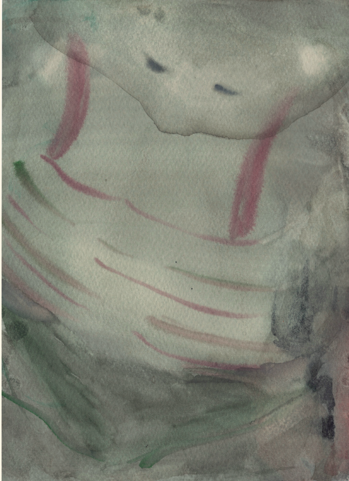
"Haiseva suudelma", 2023