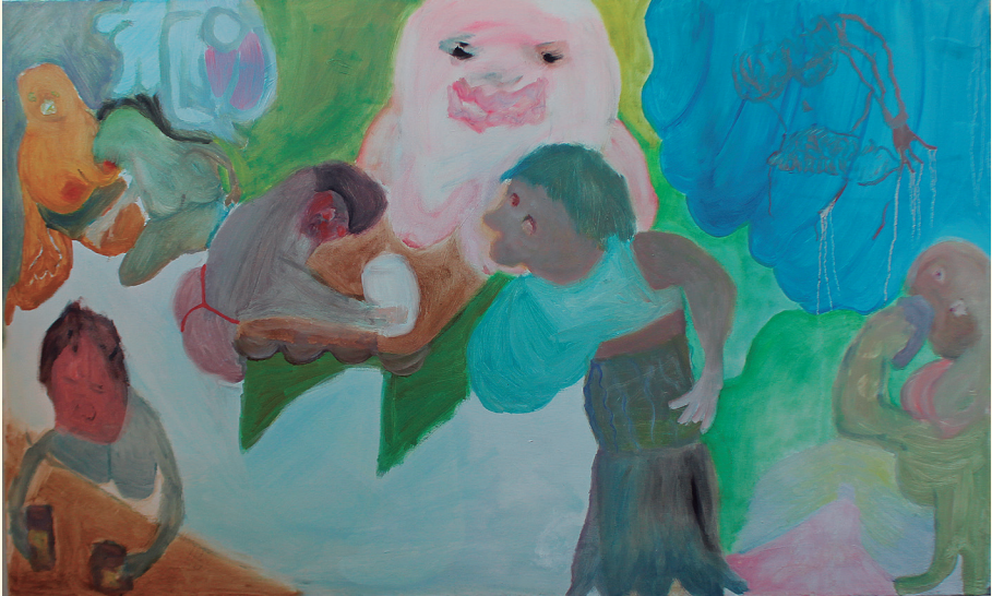
"Dinah Shore", 2024