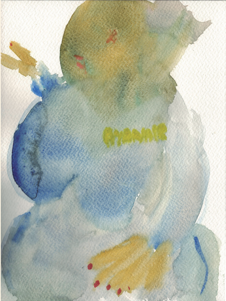
"Ensimmäinen panikkokohtaus", 2023