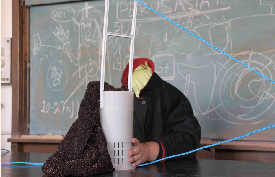
"Performanssi", 2021