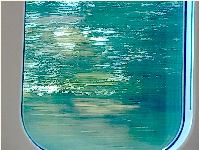
"Kehystetty liike", 2021