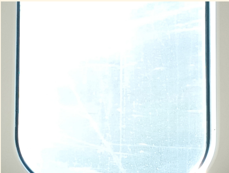
"Epäperusta (Ungrund) on ulkona", 2021