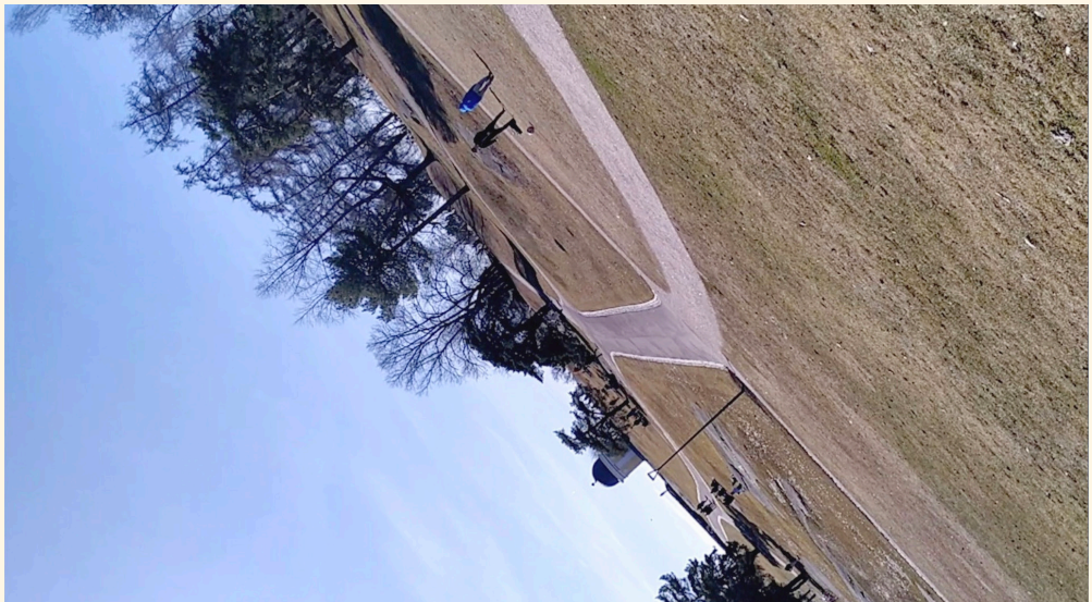
"Pallo", 2021 (still-valokuva videoteoksesta "Nimeämätön")