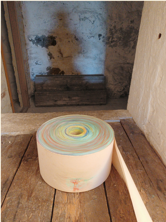
"Aika ja varjo", 2021