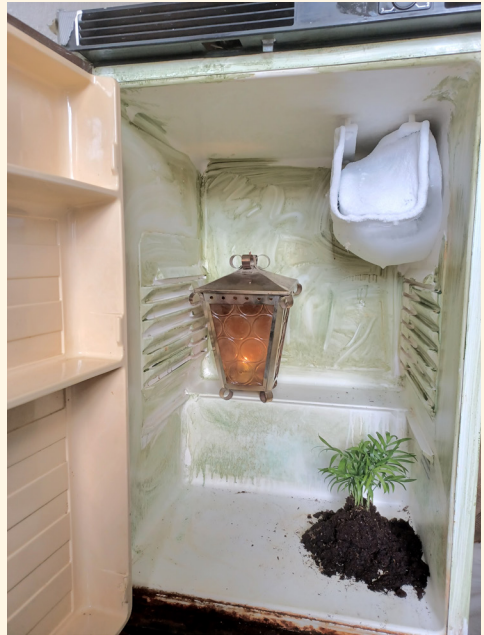
"Systeemi sekin", 2021