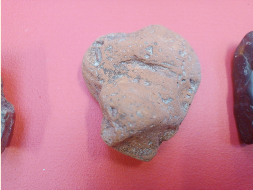
"Objet informe (meren hioma tiili)", 2021